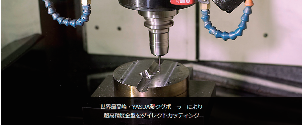
世界最高峰・YASDA製ジグボーラーにより 超高精度金型をダイレクトカッティング